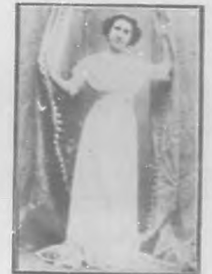
CONCEPCIÓN PARÍS Actriz