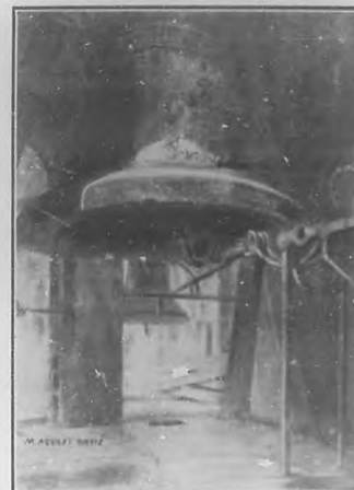
Campana grande, Catedral de Toledo.