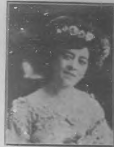
Guadalupe L. del Castillo ACTRIZ