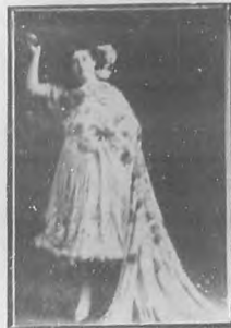
SARA U. DE TABOADA Actriz