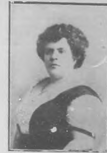
EMILIA OTAZO Actriz