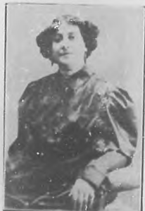
ADELA MARTÍNEZ ACTRIZ

posee arrogante figura y es elegante, y habla con gran corrección, y es amable, modesto y simpático pronto se caló el puesto honroso que hoy desempeña, con aplauso de los públicos más exigentes.