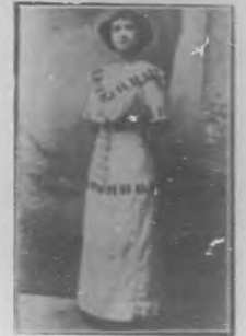
DOLORES PARÍS Actriz