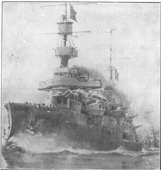
El acorazado francés "Liberté", volado en Tolón