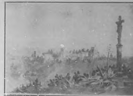
Vista general de la Alhambra de Granada, desde el Alhambra.

Modesto en grado sumo, e casi humilde, se refiere poco á sus trabajos cuando