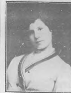
EMILIA RUIZ DEL CASTILLO Actriz