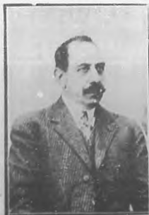
IGNACIO MONCADA Actor