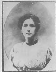
JUANA MELA Actriz