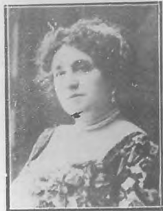
JOSEFA BOBE Actriz