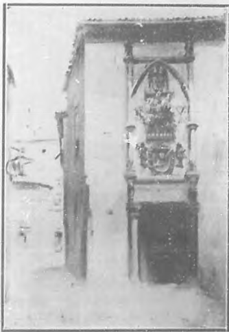
Cárcel de la Sta. Hermandad de Cuadrilleros, Toledo.

nioso de ellos, la darán muy clara del dibujo correcto y de los profundos conocimientos que de la perspectiva tiene el autor. Es un perspectivista de primera, entre los primeros, cuyos conocimientos hemos podido apreciar no solo en sus cuadros sino en las cuartillas manuscritas, que hemos logrado ver, de un tratado de perspectiva que tiene escrito y sin publicar, el más claro