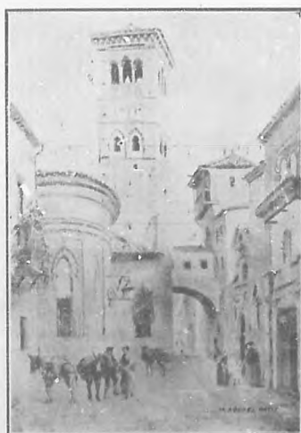
Una calle de Toledo.

y comprensible de los que conocemos. Añádase á esto lo poco que hay escrito en español, sobre dicha materia, y se apreciará la importancia que tiene ese trabajo, principalmente para los que no hablan otro idioma.