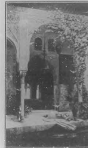
Vista interior de un patio de la Alhambra de Granada. Foto de M. Aguirre (1911)