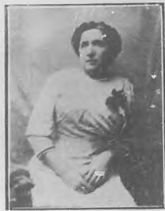
ELOISA JIMENEZ DE LERA Actriz