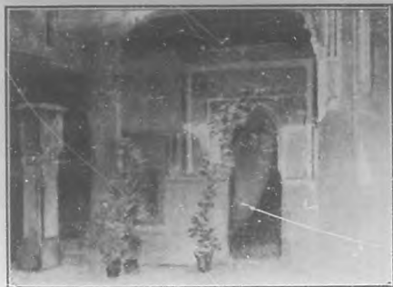
Casa llamada de El Greco.