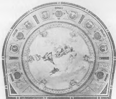
Bosquejo de techo en el Teatro "Roma", Murcia.

Las reproducciones de sus cuadros, que hoy publicamos, si bien no pueden dar por ser en negro, una idea completa del color brillante y armo-